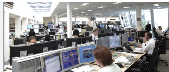
Beispiel: Nord LB, Hannover

Cool-Top: effizientes Kühlen ohne Zugluft Die am Arbeitsplatz entstehende Wärme wird an der Quelle eliminiert. Cool-Top kühlt den Technikraum und die Bildschirme mit einem in sich geschlossenen Luftkreislauf. Die Wärme gelangt so gar nicht erst in den Raum.