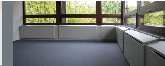
Beispiel: Basler & Hofman Ingenieure

Im Aufenthaltsbereich keine fühl- oder hörbare Luftbewegung. Luftstrahl nur entlang des Fensters.